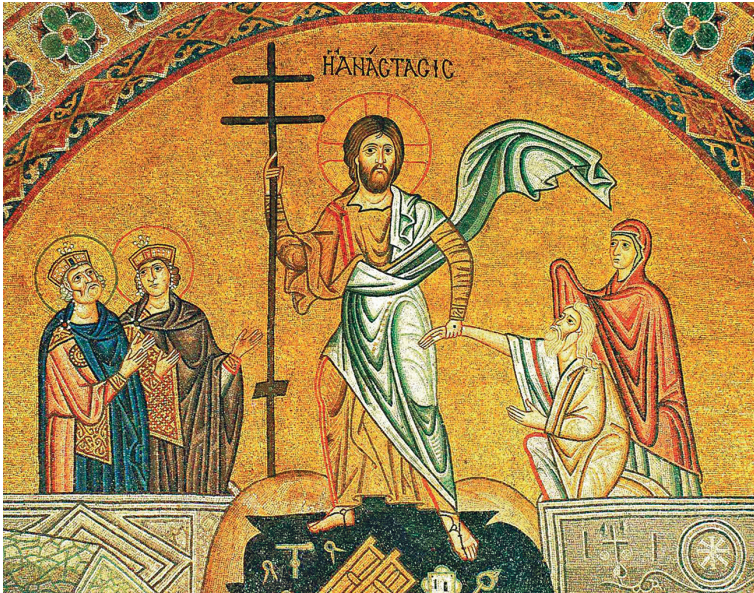
Воскресение Христово. Начало XIV в. Фреска монастыря Ватопед на Афоне

Иисуса само по себе было лишено политической составляющей, и Он не ставил ни перед Собой, ни перед Своими учениками каких-либо политических целей. И тем не менее проповедуемое Им учение вступало в перманентный конфликт с земными стандартами по той причине, что оно ориентировало людей на иные ценности. Говоря «Царство Мое не от мира сего» (Ин. 18:36), Иисус подчеркивал иноприродность миру и любой мирской власти того Царства, о котором Он говорил.