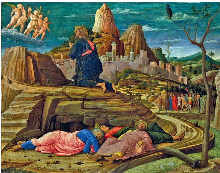
Моление о чаше. Андреа Мантенья. 1455 г. Деталь триптиха в Сан-Дзено Маджоре

площением на практике того учения, которое Он дал Своим ученикам» 34 .